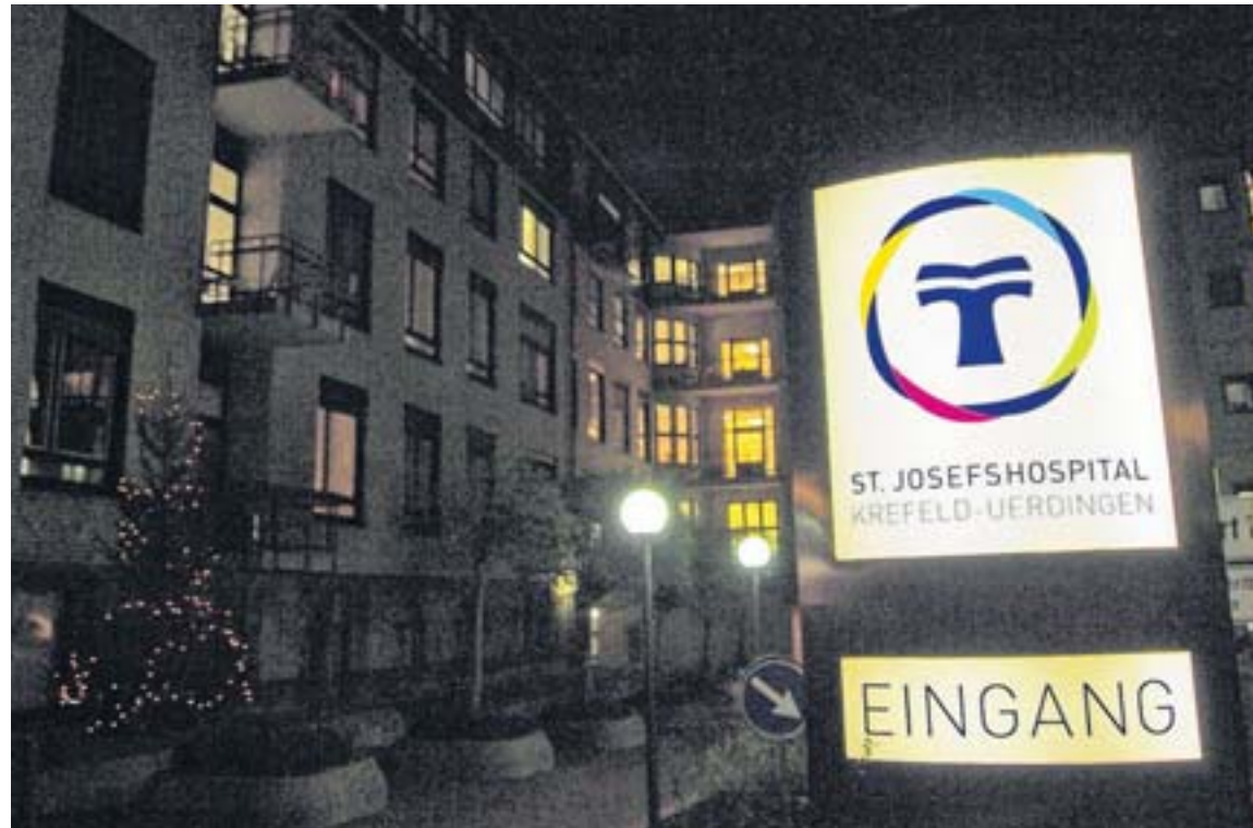
Das Uerdinger St. Josefhospital: Um 1380 wurde es als „Hospital zum heiligen Michael“, heute „Klöske“, an der Oberstraße, von Uerdinger Bürgern gegründet. Heute umfasst es acht Kliniken mit zehn Krankenstationen.